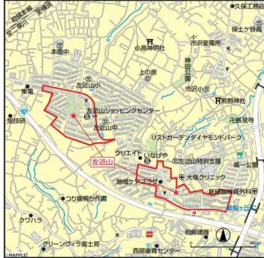
40-118 左近山 R05-09-13 1-1 (修正)R05-09-29