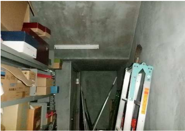
倉庫 直管ランプ 1本