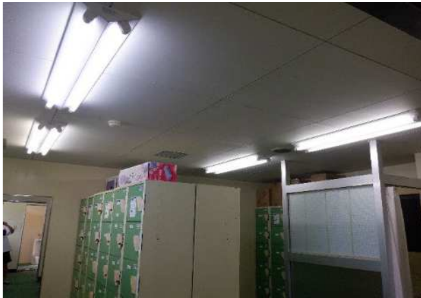
男子更衣室 直管ランプ 4台×2本=8本