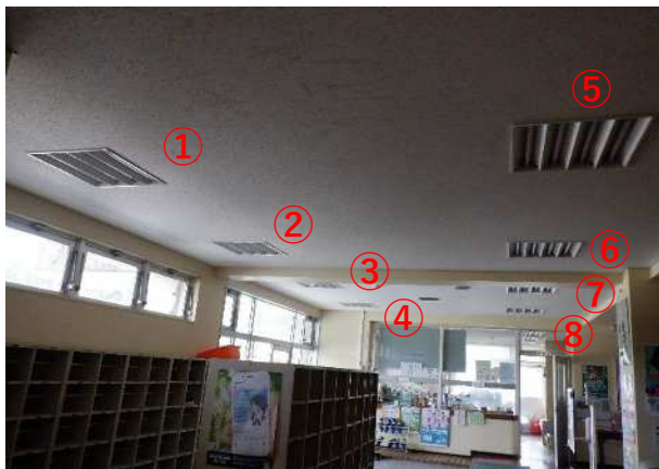
玄関 直管ランプ 8台×4本=32本