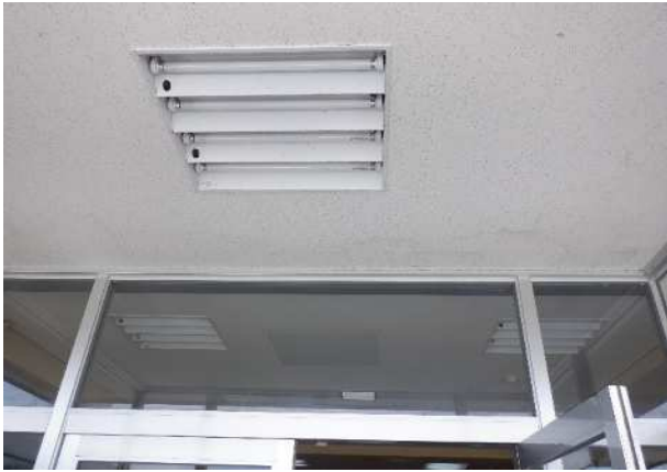
風除室 直管ランプ 4本