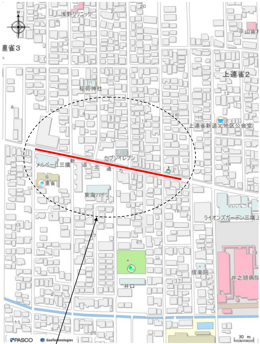
工事箇所 三鷹市上連雀三丁目地内ほか